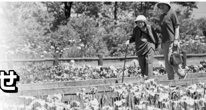
写真と本文は関係ありません