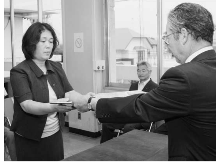
当選証書を附与される古川会長（写真左）