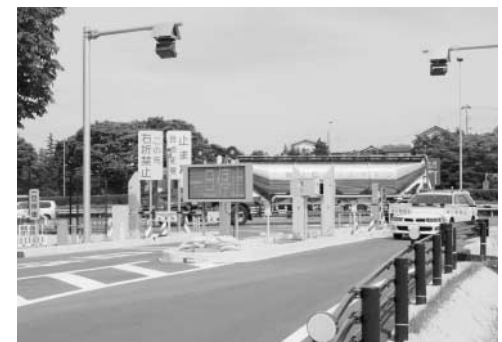
鏡石スマートIC、1回でも多くのご利用を。

鏡石パーキングエリア（PA）を利用した鏡石スマートインターチェンジ（IC）社会実験は、本年9月に1年を迎えることになりました。鏡石スマートIC社会実験協議会では、これを契機としてスマートICの恒久化に向け、次の日程により「鏡石スマートIC町民大会」を開催します。