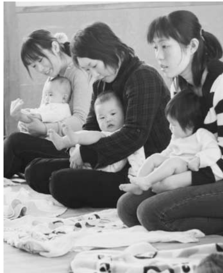
つどいの広場 子育て講座から

社会保険・健保組合などの方の手続きは 4月から新5年生及び新6年生になる保護者の方には、登録申請のご案内をしています。まだ手続きがお済みでない方は、お早めに申請してください。 なお、医療費の助成を受けるには、「受給資格証」が必要になります。登録された方には、3月下旬に郵送しますのでご確認ください。 受給資格証が変わります 4月から乳幼児（0歳から6歳児）と小学生との資格証を区別することになり 国民健康保険の方の手続きは 新4年生から新6年生のお子さんには、負担割合の表記を変更した新しい保険証を3月下旬に郵送します。それ以外のお子さんは、9月下旬の一斉更新まで、現在お持ちの保険証をお使いください。 問い合わせ先 町税務町民課 ☎62-2112