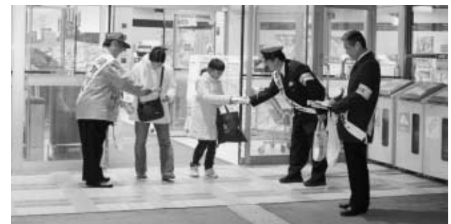
▲ スーパーなどで啓発活動を実施

事故や事件が多くなる年末年始を安心して過ごせるよう、町の交通安全団体や防犯団体は街頭にて啓発活動を実施しました。防犯出動式が12月12日(金)交通安全飲食店訪問が12月18日(木)行われました。各団体のみなさんのパトロールなどの実績が犯罪件数、交通事故件数の増加を防いでおり、今後益々の活躍に期待されるそうです。