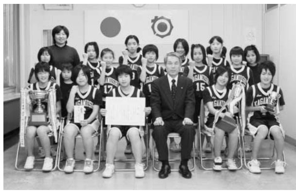
▲ 木賊町長を囲み力強くガッツポーズする選手たち