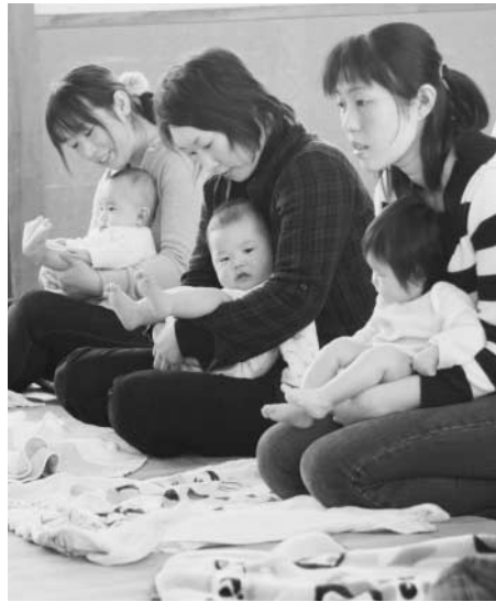
つどいの広場 子育て講座から

ました。乳幼児のお子さんは、現在お持ちの資格証を引き続きお使いください。 新1年生から新4年生のお子さんには、有効期限を更新した新しい資格証を3月下旬に郵送します。