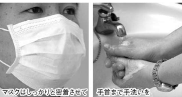
マスクはしっかりと密着させて 手首まで手洗いを

申込みください。(1人1点のご応募とします。また、未発表のものに限りです。) ◎選考結果 町で選考を行い、町のHPなどで発表いたします。入賞者には直接お知らせいたします。 ◎副賞 採用された方には記念品を贈呈いたします。 ◎その他 採用された愛称名は鏡石町に帰属するものとします。なお、都合により愛称を修正することがあります。