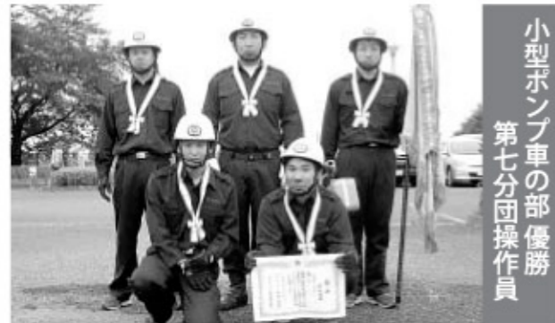
小型ポンプ車の部 優勝 第七分団 操作員