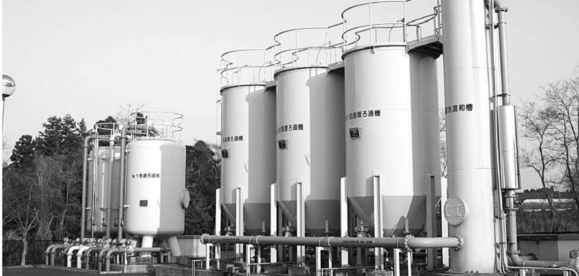
▲桜岡浄水場ではこのろ過機を使ってろ過した水を給水