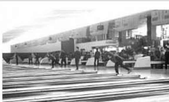
▲最高齢参加者は男女とも84歳