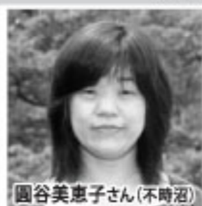
北海道 札幌市出身