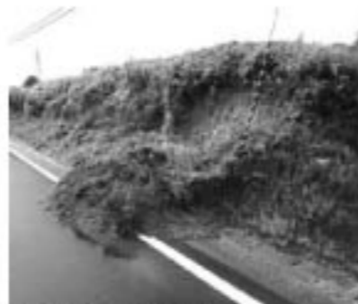
▲雨れた土手が道を覆う

このコーナーにご協力いただける方を募集します。故郷の思い出を語ってみませんか。お問い合わせは、町総務課(☎62-2111)までお電話ください。