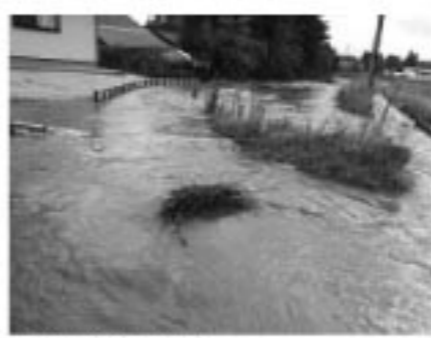
▲増水し溢れた河川

7・26 大雨被害 7月25日から26日にかけて、鏡石町で局地的に降った大雨により、町では、各地で土砂崩れなど大きな被害が出ました。 今回の雨では二日間の総雨量が138.5mmで一時間当たりの最大降雨量が48.5mmと、天気予報での表現だとバケツをひっくり返したような雨が降りました。 近年では全国でこのようなゲリラ豪雨が頻繁に発生しています。災害はいつ発生するかわかりません。今回の大雨をきっかけにご家族でも災害対策についてぜひ話し合ってみましょう。