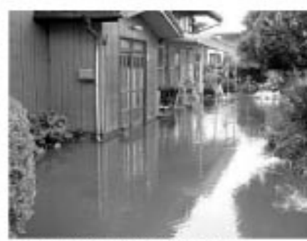
▲床下浸水の被害も多く発生しました。

9月9日は「救急の日」です 救急の日、昭和57年に救急医療及び救急業務に対する国民の理解と認識を深め、救急医療関係者の意識高揚を図ることを目的として定められました。 ■もし、今あなたの大切な家族、友人の心臓や呼吸が止まったら… 普段何気なく生活している中で、あなたの大切な人がいつどこで病気がけがにおそわれるかわかりません。つききまで一緒に話していたのに、突然、心臓や呼吸が止まってしまい倒れてしまった…。その場に居合わせたあなたは どうしますか？ 下の図1をご覧ください。心臓や呼吸が止まってしまつてから命が助かる可能性を、その場に居合わせた人が処置をした場合と救急車が到着するまで何もしなかった場合をグラフで表したものです。何もしなかった場合に比べ、処置をした場合は命が助かる可能性が緩やかに上がっているのがわかります。 あなた、大切な人の命を救うのは、その場に居合わせたあなた自身なのです。