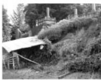
▲大雨で倒れた土手

7・26 大雨被害 7月25日から26日にかけて、鏡石町で局地的に降った大雨により、町では、各地で土砂崩れなど大きな被害が出ました。 今回の雨では二日間の総雨量が138.5mmで一時間当たりの最大降雨量が48.5mmと、天気予報での表現だとバケツをひっくり返したような雨が降りました。 近年では全国でこのようなゲリラ豪雨が頻繁に発生しています。災害はいつ発生するかわかりません。今回の大雨をきっかけにご家族でも災害対策についてぜひ話し合ってみましょう。