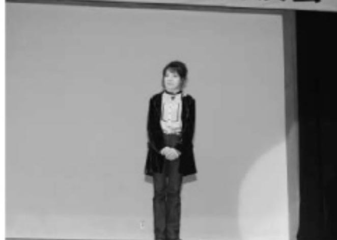
▲60才をむかえるその体型はデビュー当時から全く変わらないそうです。