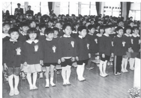
広報紙 平成11年4月号より 【鏡石幼稚園卒園式より】

私が広報を担当して2年が経過しました。この2年間で自分が作っているものを振り返りますが、まだまだ改良の余地がありました。まずは、広報紙全体で字が多いこと。ページ数の都合もありますが、たくさん詰め込みすぎの感じがしました。次に特集記事。もっと特集を組む時は深く掘り下げた内容で掲載したいです。最後に写真の技術力。もっとレベルアップして、上手に写真を撮りたいと思います。そんな広報マンも3年目というところで、広報がみいしの大活躍ニューアールを考えていますので楽しみにお待ちください。