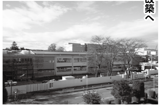
▲順調に改築が進む鏡石一小

東日本大震災で大きな被害を受け改築されることとなった鏡石第一小学校ですが、11月末現在で工事の進捗率は80パーセントとなっています。 今後は、平成26年2月から新校舎での授業が始まる予定で、その後、仮設校舎の解体とグラウンド整備が行われる予定です。