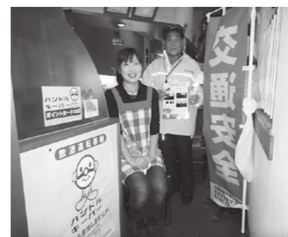
▲町内飲食店へハンドルキーパーのPR

この時期は、忘年会・新年会等で飲酒する機会が増える季節です。町の交通安全関係団体では、飲酒運転の撲滅、交通事故ゼロを目指して日夜を問わず活動しています。 町交通安全協議会、交通安全協会、交通安全母の会では、交通安全運動期間中、町民の皆さんが安全に安心して過ごせるよう、各種交通安全運動を展開していきます。 運動では、飲酒運転撲滅を目指して町内各飲食店への呼びかけや、シートベルト着用指導、夕暮れ・夜間時の交通事故防止について、広報車両などをとおして呼びかけていきます。 また、町内の交通事故発生件数は、10月末日現在で59件、昨年対比で14件の大幅な増加となっています。特に、朝夕の通勤時間帯に国道4号での追突事故が多くなっております。大切な命を守るため、交通事故に十分注意して出かけください。