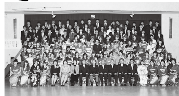
▲昨年の新成人を迎えたみなさん

成人式当日は、広報マンが成人のみなさんへ写真撮影や将来の夢や親への一言などをインタビューすることがありますので、ご協力をお願いします。また、広報紙に出てみたい方がいましたら、緑の腕章を付けた広報マンに一声かけてみてくださいね。