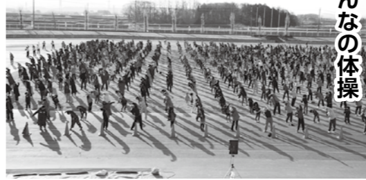
▲たくさんの参加者で埋め尽くされた鳥見山陸上競技場

NHKラジオで全国に向けて生中継される「特別巡回ラジオ体操」が4月28日(日)に鳥見山陸上競技場で開催されました。 当日は晴天の中、子どもから高齢者まで幅広い年代の1,500人を超える参加があり、ラジオを通して鏡石町の元気が全国へ届けられました。