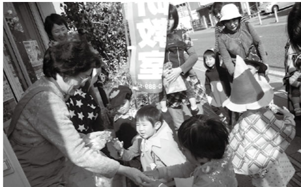
▲「トリック オア トリート(お菓子をくれないといたずらするぞ)」

ハロウィン・パーティーには親子で約70人が参加し、本町商店街13店の協力で可愛いお化けやアニメキャラに仮装した子どもたちが、商店街を回ってお菓子などをもらいました。