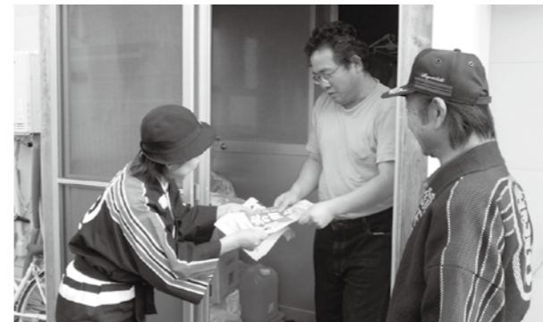
▲火災発生の防止を呼びかける消防団と女性消防隊