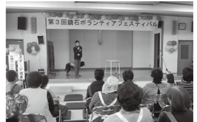
▲盲導犬のデモンストレーションも披露されました

当日は、町内で活躍する福祉・ボランティア団体や町民など約400人が参加し、お互いにボランティアへの理解と関心を高めました。