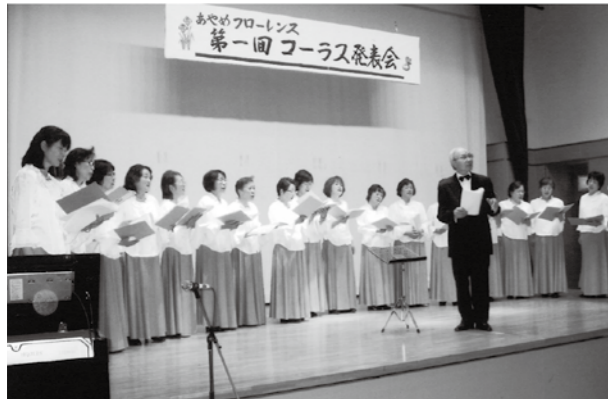
▲素敵な歌声に会場のみなさんは酔いしれました