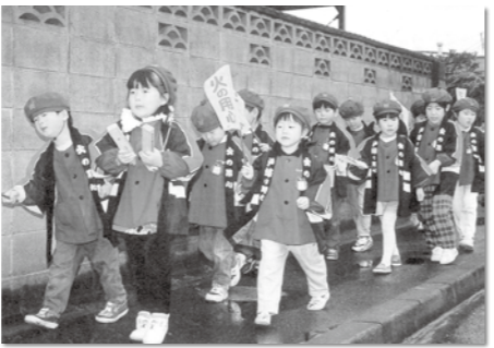
広報紙 平成9年12月号より 「鏡石幼稚園児による防火火災パレード」

12月ですね。早いもので今年もあと少しになりました。みなさんは今年の目標は達成できましたか?私の目標であるダイエツは成功というわけではありませんが、とりあえず現状維持で頑張っています。