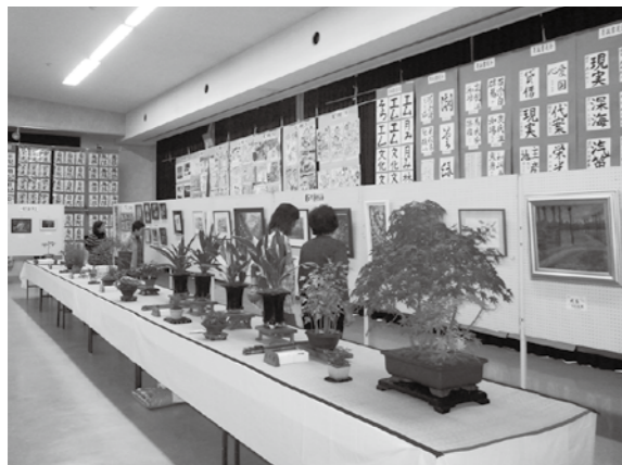
▲素晴らしい作品が揃った文化祭会場