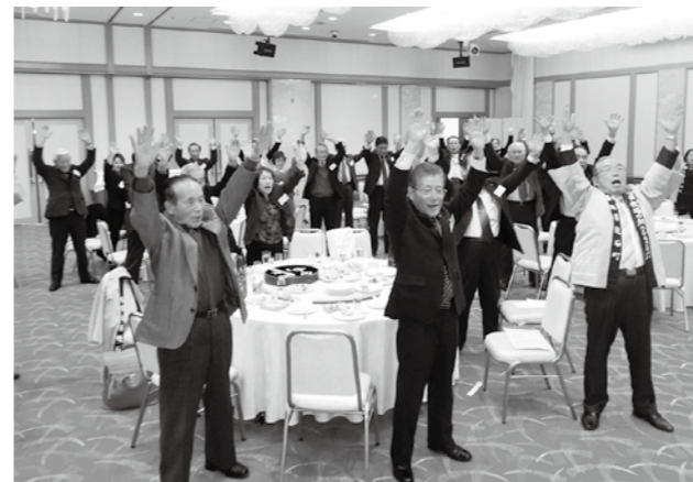
▲今年度の総会を祝して出席者全員での万歳三唱