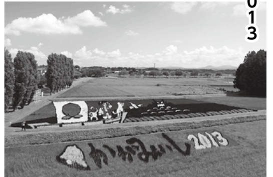
▲鬼ヶ島に鬼退治に向かう桃太郎

田んぼアート事業は農業と観光が連携した取組として昨年からは始められたもので、昨年の「牧場の朝」のイメージに続き、今年は「桃太郎」をテーマに描かれました。 今年「田んぼカフェ」や「桃太郎祭り」も開催され、昨年の倍以上となる13,000人を超える観覧者が訪れ大盛況となりました。