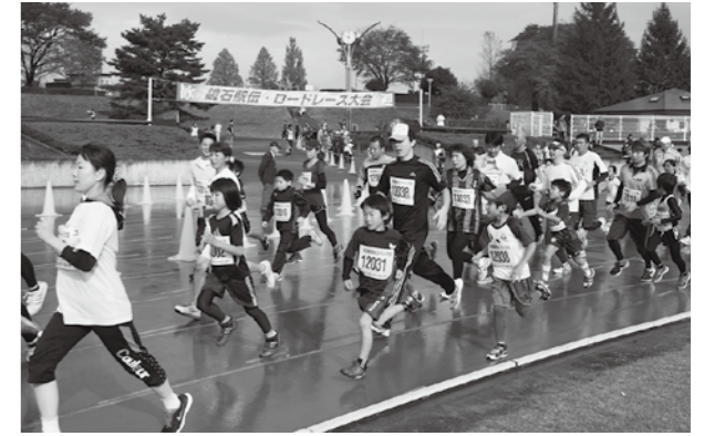
▲親子の部でも真剣に走る参加者のみなさん

ロードレースの部では、885名、駅伝の部では、31チーム155名のランナーがエントリーしました。また、参加したランナーのみなさんには、ゴール後に体が温まるみそ汁が無料でふるまわれました。