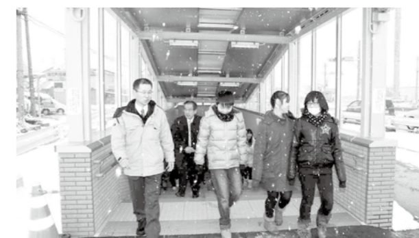
▲鏡石町役場入口地下歩道の通り初めの様子

鏡石一小児童も協力しました 国道4号鏡石拡幅において、安全に道路を横断できるよう、町内には地下歩道が2カ所設置されます。 今回、地下歩道の名前を表示する「銘板」の制作にあたっては、鏡石第一小学校6年生18名が1文字づつ下書きを行いました。 ◎問い合わせ先 国土交通省東北地方整備局 郡山国道事務所 024-946-0333