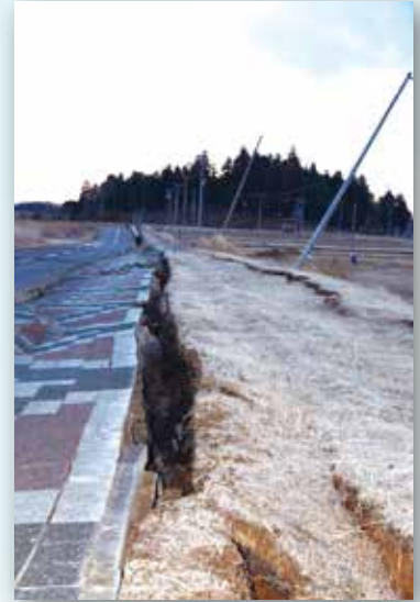
▲亀裂の入った道路と傾いた電柱

平成23年3月11日(金)に東日本を中心に日本列島に激震をもたらした巨大地震から早2年。町でも大きな被害を受けましたが、あの大変な出来事を忘れず教訓とすることで、未来へつなげるために当時の状況を振り返ります。