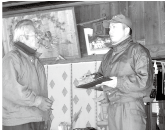
▲防火について消防署員の指導を受ける文化財の管理者

文化財を未来に伝えていくために、町民の皆様には文化財を管理する方々とともに文化財保護へのご協力をお願いいたします。