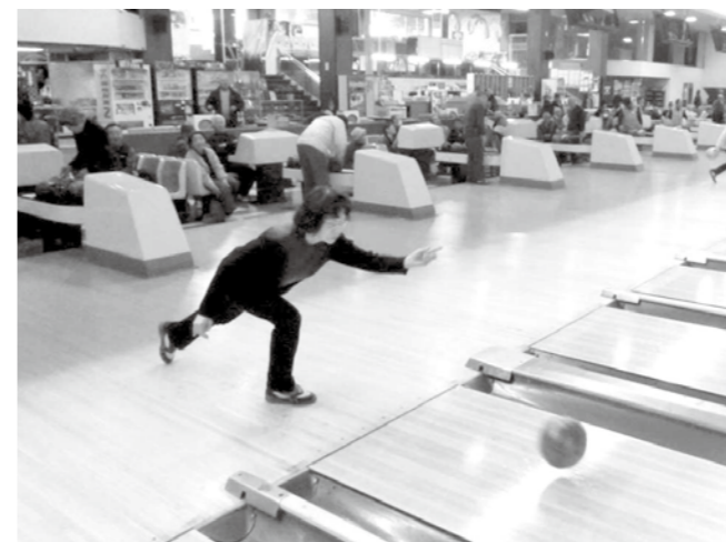
▲狙うはストライク、そして高得点