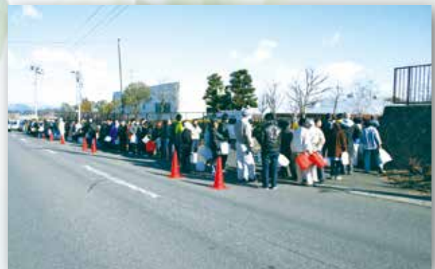
▲断水による浄水所での給水には長蛇の列