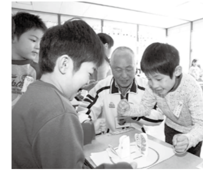
▲熱戦！紙相撲「昔遊び」