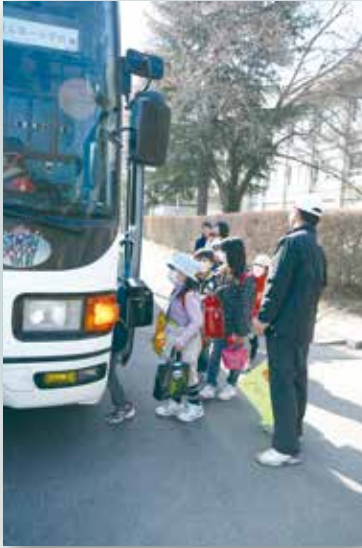
▲鏡石一小校舎の被災により二小及び構造改善センターへバス通学