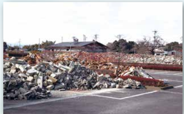
▲鳥見山公園北側駐車場の倒壊家屋等の瓦礫