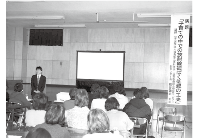
▲放射線について真剣に学ぶ参加者たち

3日は41名、4日は43名の参加があり、参加者は放射線被ばくの低減などについて、講師のわかりやすい説明で詳しく学ぶことができた様子でした。