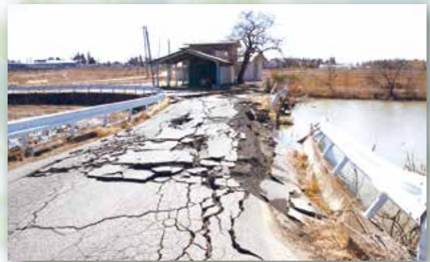
▲決壊寸前だった蒲之沢池前の道路