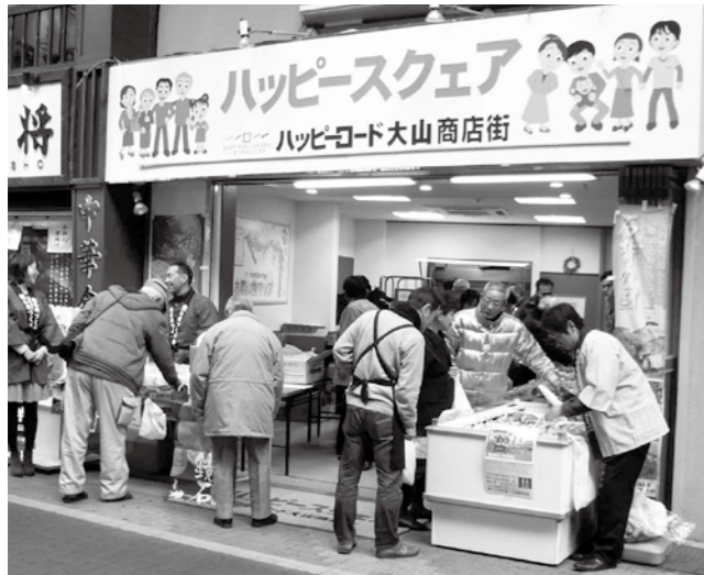
▲町の特産品の売れ行きは絶好調でした