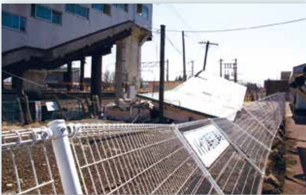
▲鏡石駅も大きな被害