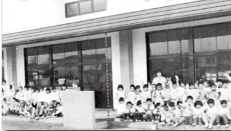
広報 昭和62年3月号より「鏡石幼稚園児新園舎に大喜び」

もつ3月ですね。私が広報を担当してからもうすぐ1年です。広報を担当する前は福島県庁へ1年間の研修に行っていた大変でしたが、楽しく研修させていただきました。何故か知識が増えたのに比例して、体重も過去最大に増えてしまいました。... 3月といえば、子ども達は卒業式シーズンです。やり残したことがないように学校生活を楽しんで、新生活へ進んでほしいと思います。卒業式では広報マンも写真撮影をする予定ですが、今から緊張しています。