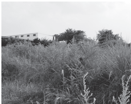
▲早めの除草をお願いします

また、犯罪の温床となることもありますので、空き地は土地の所有者や管理者が定期的な除草や清掃など責任を持って管理をお願いします。