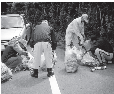
▲ゴミ拾いをする環境を考える会のメンバー

い出がいっぱいある方が老後は楽しいですよ。みなさんも美しいふるさとを守るために行動してみませんか? 各家庭や事業所でも、工夫やマナーについて考えるなどの共通の目標を持つことが大切だと思います。他人を思いやる心は誰にでもあります。ただ、それを行動に移し、一人ひとりが地域とのつながりを持つことが「絆」だと思います。地域の絆を大切にみんなで力を合わせてがんばらばいい!!