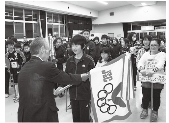
▲団旗を受け取り気持ちを引き締める子ども達