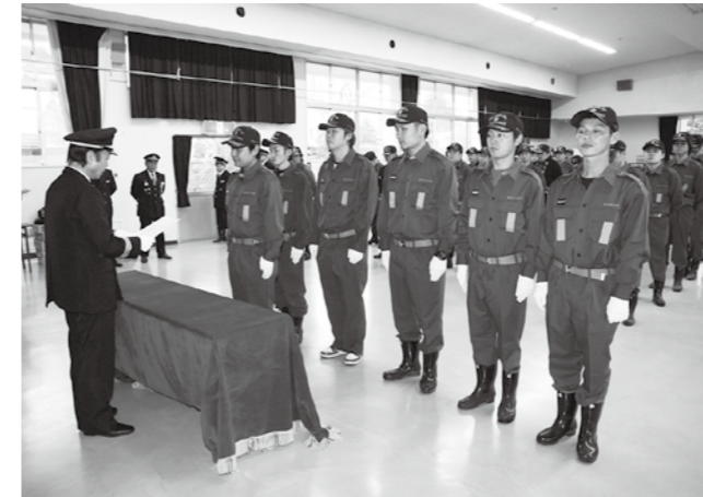
▲小林団長より昇格辞令を受け取る団員

式終了後には須賀川消防署鏡石分署の指導により、規律訓練、応急処置、放水訓練が行われました。