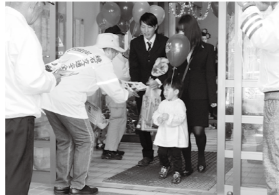
▲風船とチラシを配って交通安全を呼びかけました

テント村では、交通安全協会・母の会の役員及び理事により交通安全に関するチラシや風船が配られ、受け取った子ども達や保護者は、親子で交通安全に対する理解を深め合っていました。