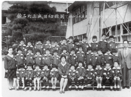
▼昭和44年度第1回入園式