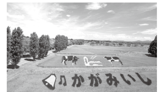
▲今年の田んぼアートの絵柄は…？(写真は昨年度田んぼアート)