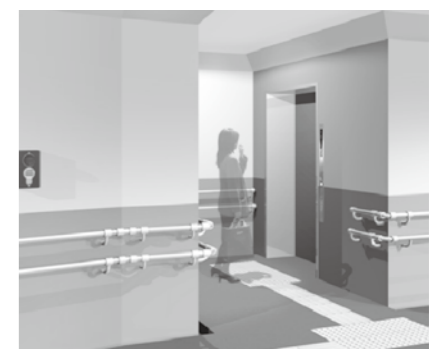
地下のエレベーター付近

◎問い合わせ先 国土交通省東北地方整備局 郡山国道事務所 024-946-0333 町都市建設課 62-2116