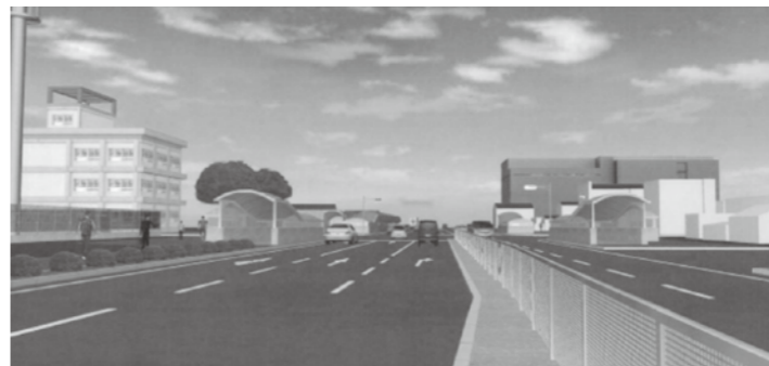
全景(国道4号、矢吹方向)

一部完成し、今後は、残る本体工事と地上部の上屋、エレベーター等の機械設備、内装等の各工事を進めてまいります。なお、鏡石第一小学校の皆さんの安全を考慮し早期の完成を目指します。