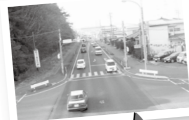
▲2007.12.2撮影 役場前交差点 歩道橋上より

町を南北に貫く国道4号線。4車線への拡幅工事が進められ、町の風景が変わって来ています。風景の変化を写真で眺めてみます。