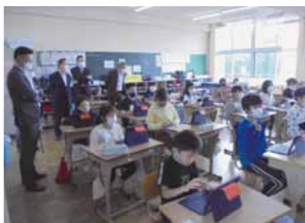
iPadを使った授業を視察

「町民の声」提出先 鏡石町議会事務局 〒969-0492 鏡石町不時沼345 電話62-2110 ☆郵送、持参のほかに、町ホームページからも投稿できます。 URL / www.town.kagamiishi.fukushima.jp/