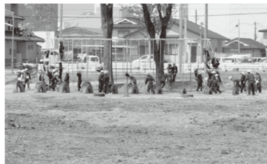
新たなグラウンドが整備される一小

東日本大震災のため仮設校舎で授業をしていた第一小学校では、新しい校舎が完成したことにより、仮設校舎を撤