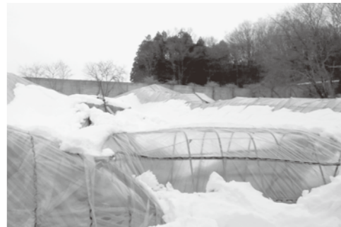
2月の大雪による被害

ハウス農家では、園芸施設や収穫期のハウスが被害に遭いました。このため今定例会では、ハウス修理等に要する経費に対する補助金として1億3千万円の補正予算を議決しました。