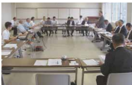
高鍋町で3つのプロジェクトについて研修

な商談会等も開催している。高鍋町では地元商店街が自らの商業活性化のために3つのプロジェクトを戦略的に実行し、「町活性化のために「新しい賑わい」を創造した。これら一連の事業について研修したが、商店街後継者らの熱意を強く感じた。 水川町では「道の駅竜北」や地場産品加工センターにおいて、地元農産物の直売や加工品の販売戦略等を研修。特に晩白柚を使った商品については、他に類がなく、大手菓子店による販売が展開される等、今後注目される商品とのことであった。