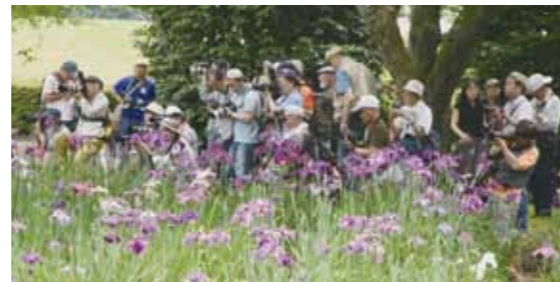
あやめ撮影会には多くのカメラマンが