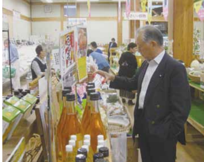
道の駅「竜北」(熊本県)を視察

発行 福島県鏡石町議会 編集 議会広報編集委員会 〒979-0401 福島県岩瀬郡鏡石町 不時沼345 電話 0248(62) 2110 印刷 (有) 永山印刷