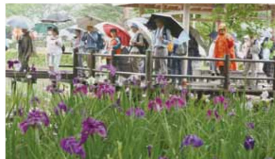
あやめウォークで園内を周遊