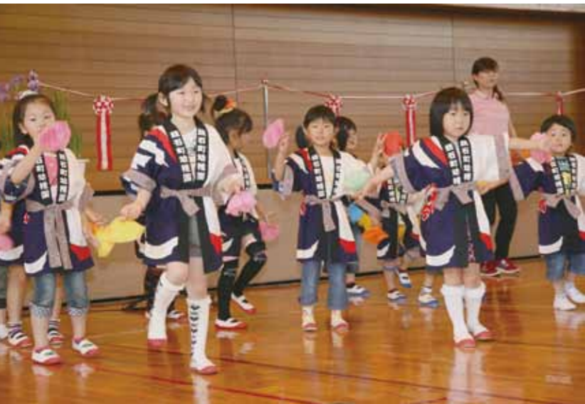
オープニングにはちびっ子よさこいで元気に