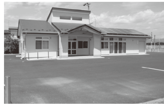
3区集会所の前に遊園地を