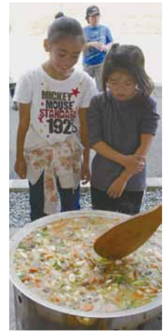
▲豚汁もおいしそう