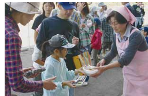
▲参加者にはおにぎりや豚汁が

大盛況だった『田んぼアート』。締めくくりは『豊作バンザイ稲刈祭り』。総勢250名で稲刈した後は、福島県オリジナル米「天のつぶ」のおにぎりと豚汁で収穫を祝いました。