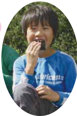
▼田んぼアート稲刈りに200人以上が参加