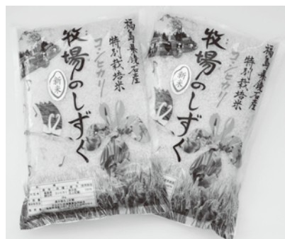
牧場のしずくのブランド化推進を

質 問 町は学校支援サポート事業が文科省表彰を受ける等充実しているが、児童生徒の個性や学力を伸ばすため、週休二日制を利用した「平成の寺子屋」授業を町民のサポートにより、実施する考えはないか。