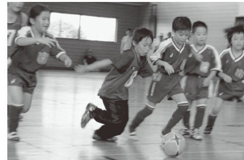
公民館事業の外部委託は考えられないか

質 問 公民館で実施されている生涯学習分野における事業数と年間の講座等の開催件数は、どれくらいあるのか。