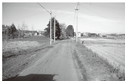
久来石行方蓮池西線工事は来年度再開

現時点では、応急的な補修で対応したい。災害復旧工事後に予算確保の上、整備について検討する。