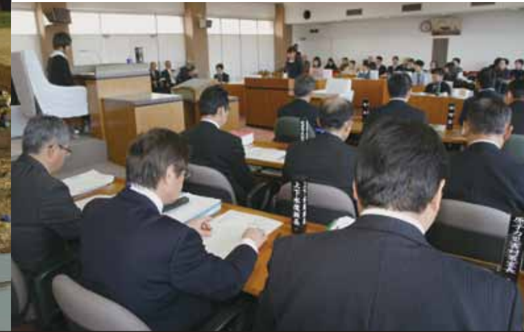
▲するどい質問に執行も真剣