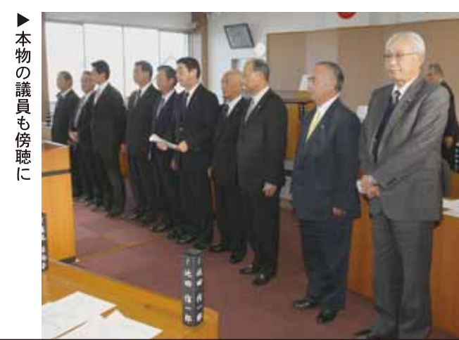
▶本物の議員も傍聴に