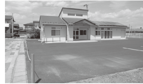
3区コミセン前に遊園地を

健康福祉課長 町内には20力所の児童公園があり、3区には不時沼遊園地が整備されているが、当該地から約600m離れている。子ども達にとっては、安全に移動して遊べる距離ではないかと考えられる。現時点では補助対象メニューが見当たらない状況であり、財源確保の観点から事業化は困難である。今後、国県に対して補助制度創設も含めて、要望したい。