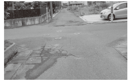
道路の早期復旧を

質問 鏡石3区コミュニティセンター前には20力所の児童公園があり、3区には不時沼遊園地が整備されているが、当該地から約600m離れている。子ども達にとっては、安全に移動して遊べる距離ではないかと考えられる。現時点では補助対象メニューが見当たらない状況であり、財源確保の観点から事業化は困難である。今後、国県に対して補助制度創設も含めて、要望したい。