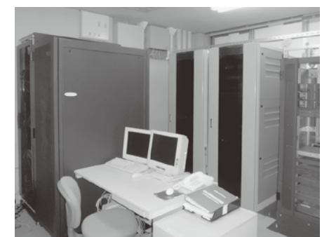
役場の情報システム機能の確保を

質 問 復興町づくり計画には仮称防災福祉センターの整備検討とある。例えば、10年後に建設では、復興まちづくり事業という趣旨が薄れてしまうのではないか。