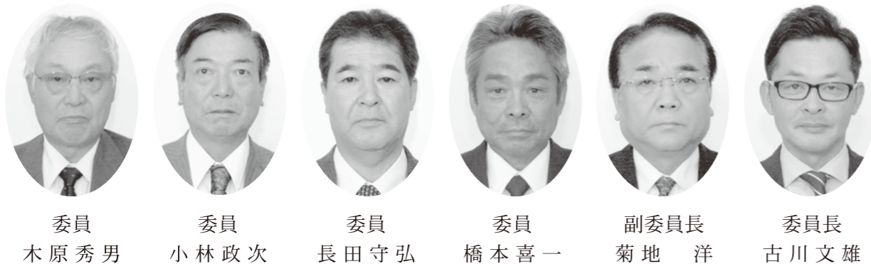
議会選出監査委員